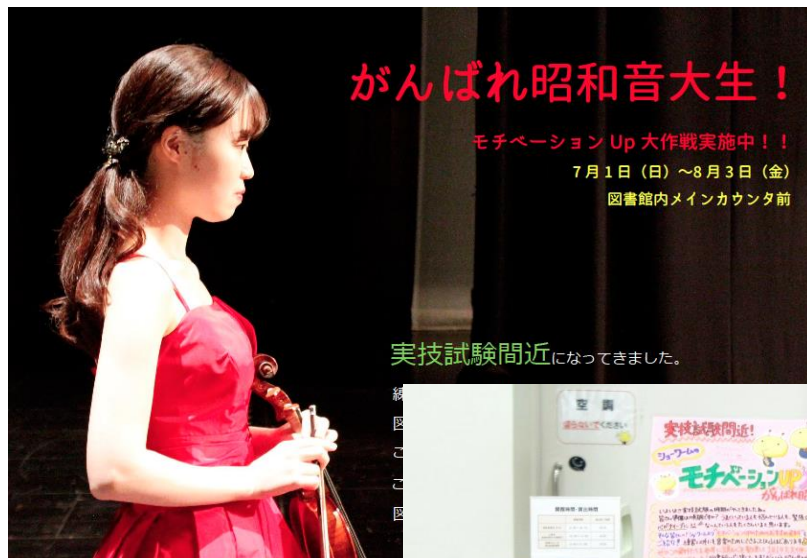
実技試験間近になってきました。

このコーナーは、大学院生・卒業生・図書館職員の合同企画で、まだ2回目の新しい企画です。該当資料は大学院生と卒業生が選んでいて、昨年1月同様今回も出した本が次々と借りられていました。該当資料は大学院生・卒業生が選んでおり、アレクサンダーテクニック、メンタル系、ストレッチなど身体のメンテナンス系や演奏法など、様々な内容の資料がたくさん並びました。借りている学生さんに話しを伺うと「気になる資料がカウンタ前にあるので、借りやすい」、「先輩が勧めてくれるので、読んでみようかなと思った」など、関心の高いコーナーだということが分かりました。今後も色々な資料を紹介していきます。